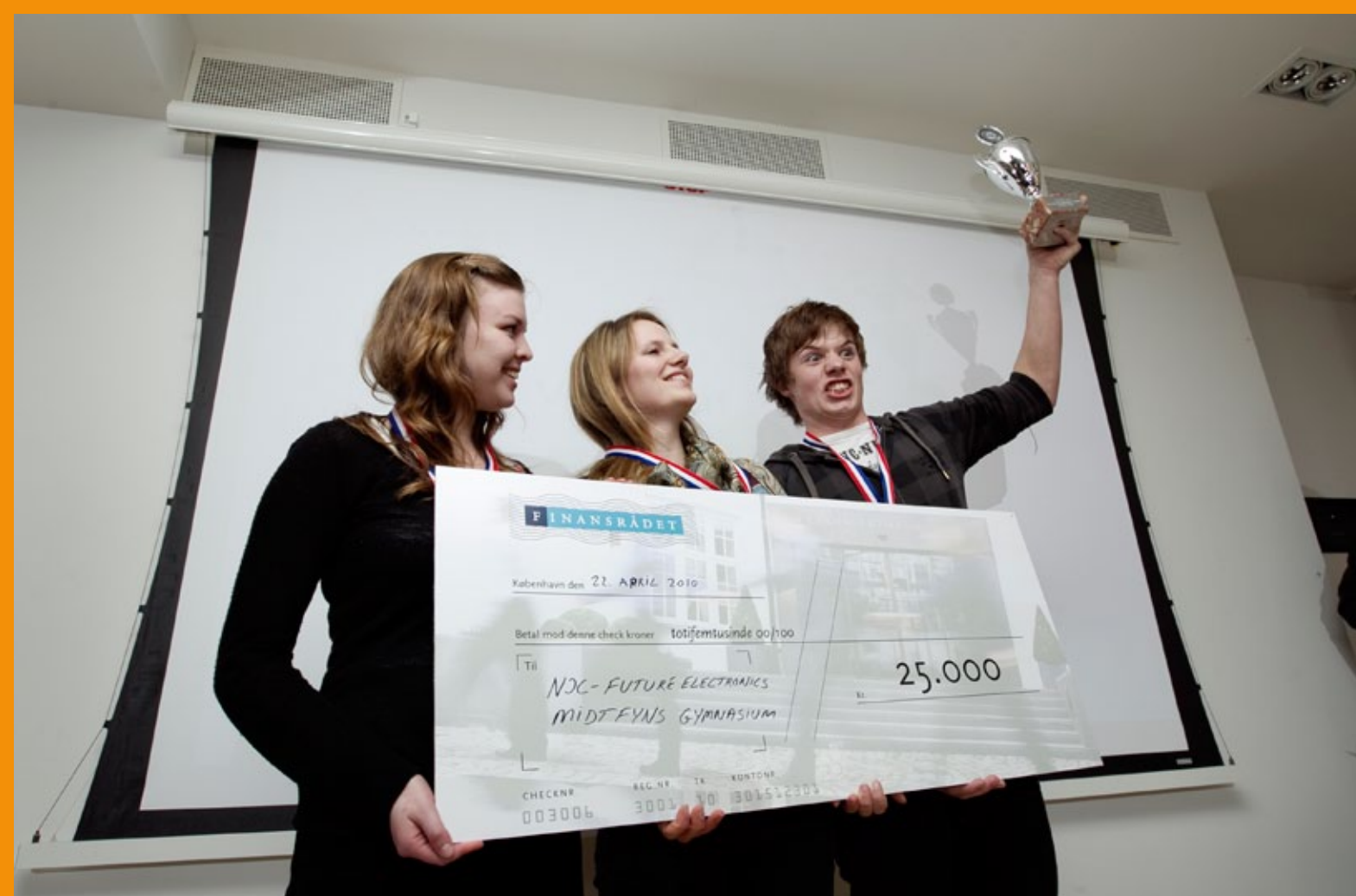
Vinderholdet 2010 - Midtfyns Gymnasium

INTERVIEW MED THOR KURE, LEKTOR PÅ BORNHOLMS GYMNASIUM (STX):